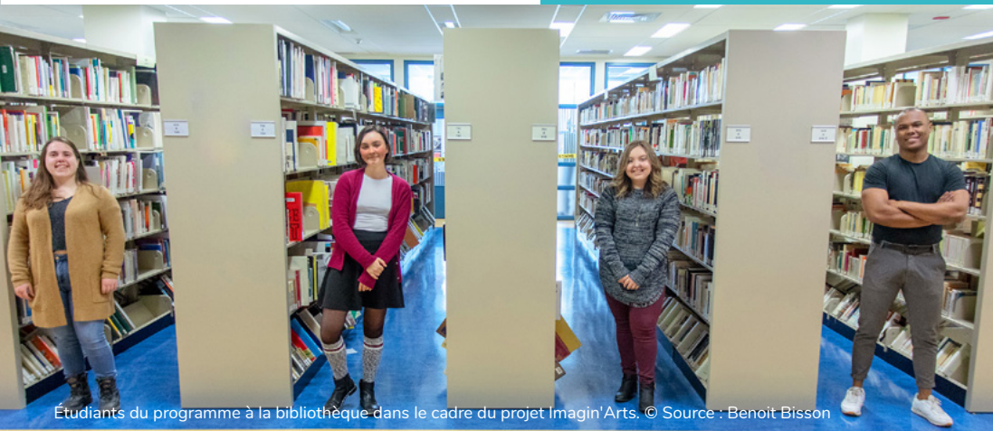
Étudiants du programme à la bibliothèque dans le cadre du projet Imagin'Arts.

Biologie humaine Initiation à la psychologie Méthodes quantitatives en sciences humaines Méthodes quantitatives avancées