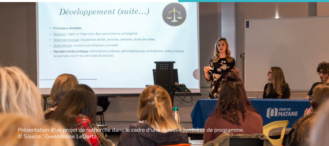
Présentation d'un projet de recherche dans le cadre d'une épreuve synthèse de programme.