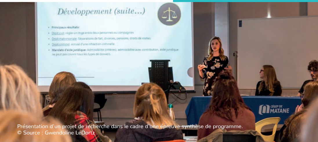
Présentation d'un projet de recherche dans le cadre d'une épreuve-synthèse de programme.