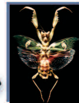
Jérôme E. Lebel