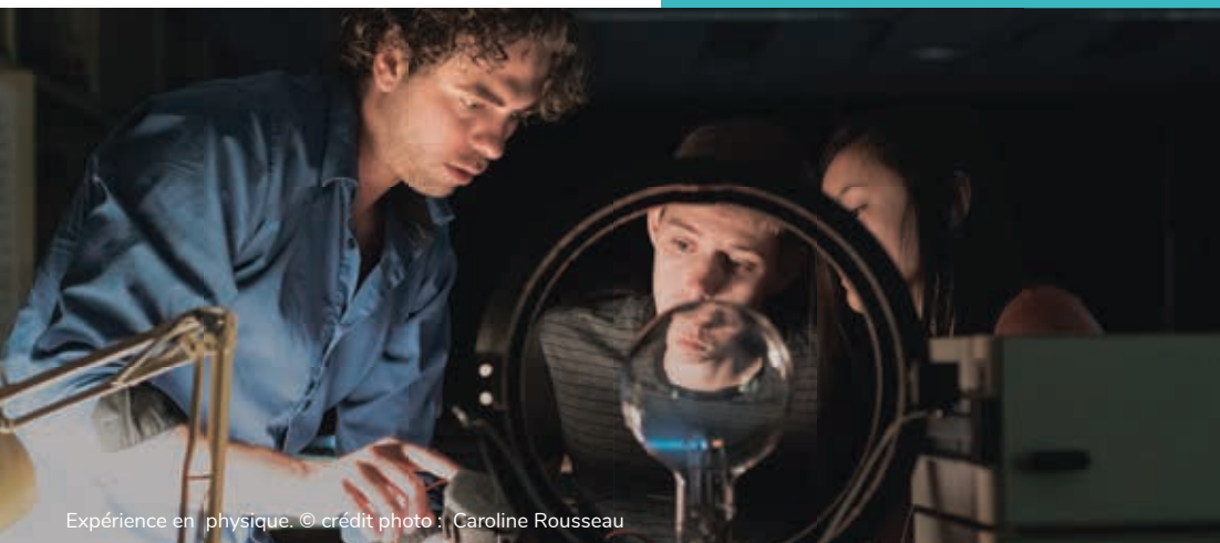
Expérience en physique.