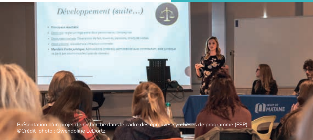
Présentation d'un projet de recherche dans le cadre des épreuves synthèses de programme (ESP).