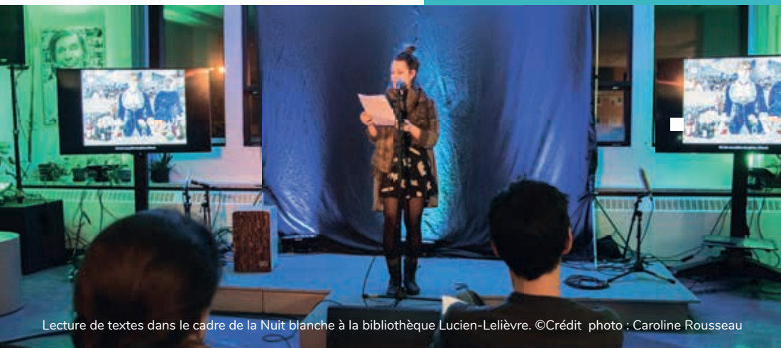
Lecture de textes dans le cadre de la Nuit blanche à la bibliothèque Lucien-Lelièvre.